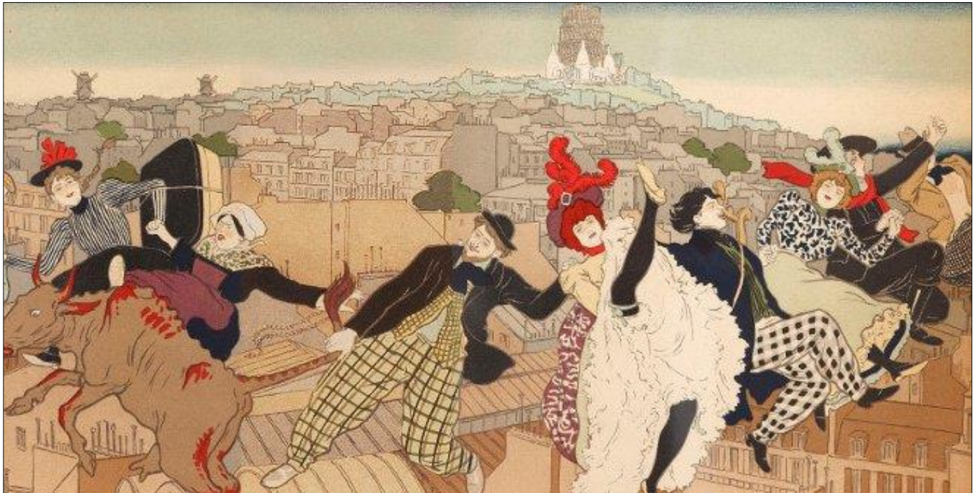
La Vie à Montmartre, 1897. Litografía. Colección particular

Este mes os recomendamos visitar la exposición " Toulouse-Lautrec y el espíritu de Montmartre ", que estará abierta desde el 20 de febrero al 19 de mayo en CaixaForum (Paseo del Prado nº 36)